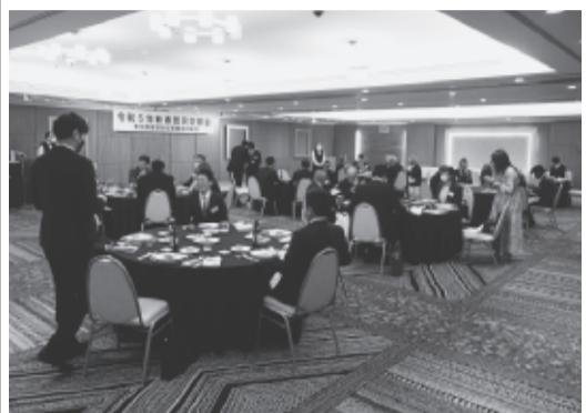
賀詞交歓会会場の風景

燃料高も変わらない、変わったのは中国のコロナ政策が転換し、なんとかサブプライムローン問題が解消したことで、今後世界経済も少しは回って来ると感じています。では我々の業界はどうだったか。昨年古紙関連洋紙は減産に次ぐ減産でした。我々の扱っている紙に關しましては、昔はお金を出して紙媒体から情報を得る、そういう時代でした。今はインターネットで、スマートフォンでお金をかさねる状況に見ることがあります。